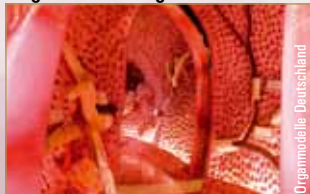
In der Rathausgalerie Begehbare Lungenmodell

RATHAUSGALERIE ERLEBEN MITTEN IM LEBENSZEITRAUM