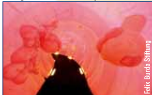
Längster Darm Europas